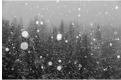
PICEA ABIES (L.) H. KARST. / ÉPICÉA — FORÊT DE MONTATUAY, ORSIÈRES