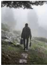
ABIES NORDMANNIANA (STEVEN) SPACH / SAPIN DE NORDMANN