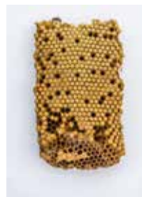
CADRE DE FAUX-BOURDONS