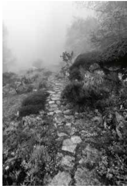
HIPPOCREPIS COMOSA L. / HIPPOCRÉPIDE COMMUNE

PIERRE ET FLEUR S'ÉPOUSENT DANS UN MÊME MONDE