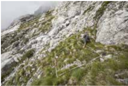
FESTUCA VARIA AGGR. / FÊTUQUE BIGARRÉE — MARGES, GLACIER D'ORNY