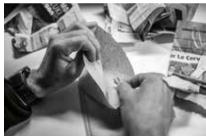
LEONTOPODIUM ALPINUM CASS. / EDELWEISS, ÉTOILE DES ALPES

VOIR CE QUI N'EST PLUS POUR PRÉSERVER CE QUI RESTE