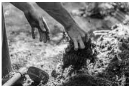
TERREAU DE CULTURE