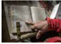
POLYGONUM PANJUTINII KHARKEV. CAHIER DE CULTURE, N° 737, GRAINES, MINSK, 1973