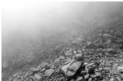
SALIX HELVETICA VILL. / SAULE DE SUISSE — MORAINES, GLACIER D'ORNY

ANTHROPISÉE, TERRE VIERGE DEVIENT SAUVAGE