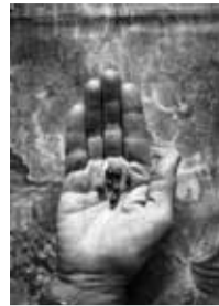
PAEONIA OFFICINALIS L. / PIVOINE OFFICINALE

JARDIN, ESPACE ARTIFICIEL QUE LA NATURE ADOPTE