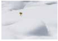
ERYNGIUM BOURGATI GOUAN / PANICAUT DE BOURGAT