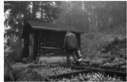
PRIMULA AURICULA L. / PRIMEVÈRE AURICULE, COLLECTION D'ESPÈCES DE PRIMULA