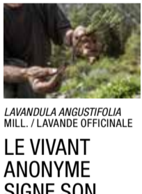
LAVANDULA ANGSTIFOLIA MILL. / LAVANDE OFFICINALE