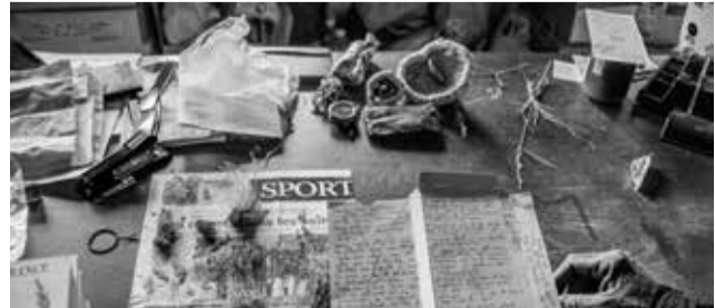
FESTUCA GR. HALLERI / FÊTUQUE DE HALLER, FESTUCA CF. INTERCEDENS (HACK.) LÜDI / FÊTUQUE INTERMÉDIAIRE, CHAMPIGNON : MACROLEPIOTA PROCERA / LEPIOTE ÉLEVÉE