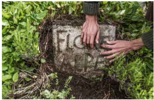
OMPHALODES VERNA MOENCH / OMPHALODÈS