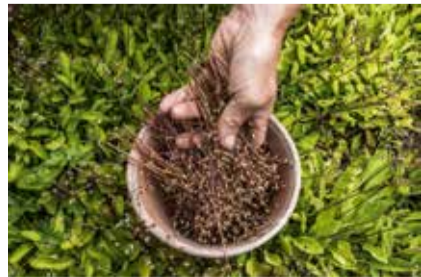
ANDROSACE STRIGILLOSA FRANCH. / ANDROSACE RUGUEUSE

L'ÉTROIT, SOURCE DE CROISSANCE POUR QUI S'Y ACCOMMODE