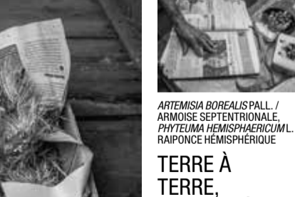
ARTEMISIA BOREALIS PALL. / ARMOISE SEPTENTRIONALE, PHYTELIMA HEMISPHERICUM L. / RAIPONCE HÉMISPHERIQUE