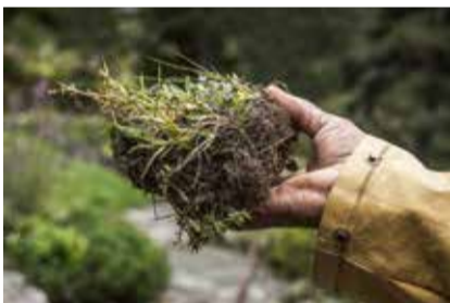
VALERIANA CELTICA L. / VALÉRIANE CELTE

L'ESPOIR FLEURIT JUSQU'À LA DERNIÈRE GOUTTE D'EAU SUR TERRE