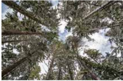
PICEA ABIES (L.) H. KARST. / ÉPICÉA

PIERRE ET FLEUR S'ÉPOUSENT DANS UN MÊME MONDE