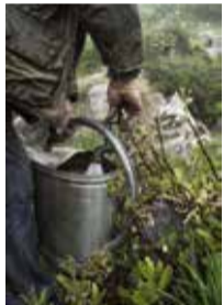
SALIX CRATAEGIFOLIA BERTOL. / SAULE À FEUILLES D'AUBÉPINE, BUPLEURUM ANGULOSUM L. / BUPLEVRE ANGULEUX