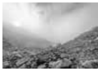
POA LAXA HAENKE / PÂTURIN LÂCHE, PICEA ABIES (L.) H. KARST. / ÉPICÉA, LARIX DECIDUA MILL. / MÉLÈZE D'EUROPE — MORAINES, GLACIER D'ORNY