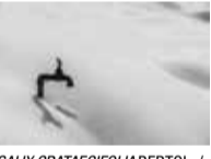
SALIX CRATAEGIFOLIA BERTOL. / SAULE À FEUILLES D'AUBÉPINE

QUI REGARDE AU SOL COMPREND CE QUI SE PASSE AU SOMMET