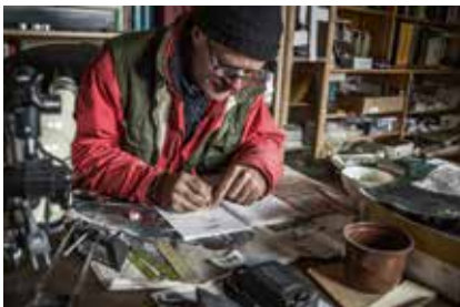
CORYDALIS CAVA (L.) SCHWEIGG. & KÖRTE / CORYDALE CREUSE