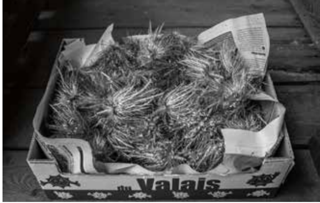
ERYNGIUM ALPINUM L. / PANICAUT DES ALPES