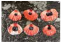
PAPAVER ORIENTALE L. / PAVOT D'ORIENT