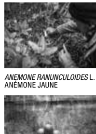
ANEMONE RANUNCULOIDES L. / ANÉMONE JAUNE

JARDIN, ESPACE ARTIFICIEL QUE LA NATURE ADOPTE