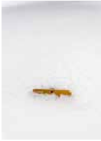
RHODODENDRON X INTERMEDIUM WENDER. / RHODODENDRON INTERMÉDIAIRE