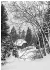
SALIX APPENDICULATA VILL. / SAULE À GRANDES FEUILLES