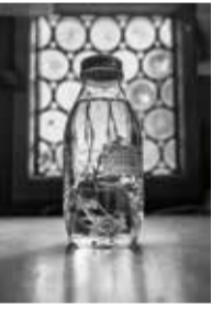
RANUNCULUS PENICILLATUS (DUMORT.) BAB. / RENONCULE PÉNICILLÉE