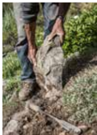
ARTEMISIA CAMPESTRIS L. / ARMOISE CHAMPÊTRE, PAEONIA WITTMANNIANA HARTWISS EX LINDL. / PIVOINE DE WITTMANN